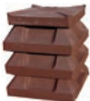
testa di moro

SCHEMA DI UTILIZZO CANNE FUMARIE E COMIGNOLI